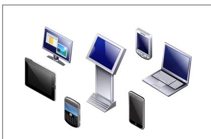
Contenu et applications, campus et personnel, accessible sur tout périphérique, à tout moment, partout