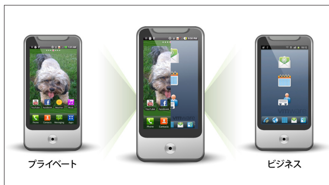
VMware Horizon Mobile では、1つのデバイス上のプライベート用環境とビジネス用環境を相互に分離し、安全かつ同時に実行できます。