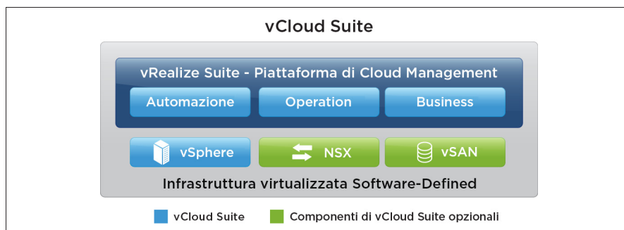
Figura 1: soluzioni integrate di vCloud Suite

Inoltre, le soluzioni di Cloud Management di VMware vRealize sono integrate in modo nativo con l'SDDC di VMware: VMware vSphere, VMware NSX® e VMware vSAN™. Le strutture di NSX (come router virtuali, unità di bilanciamento del carico e firewall) possono essere integrate in un template di servizi (blueprint) creato in vRealize Automation. È anche possibile creare istanze di tali strutture e modificarle on demand, in base alle esigenze aziendali, nel contesto dell'applicazione in esecuzione.