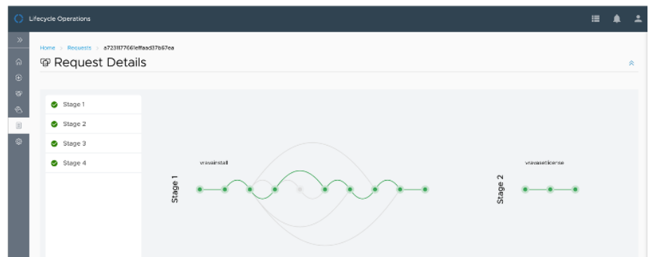
그림 2: 설치 단계의 진행 과정을 보여 주는 간편한 설치 프로그램.