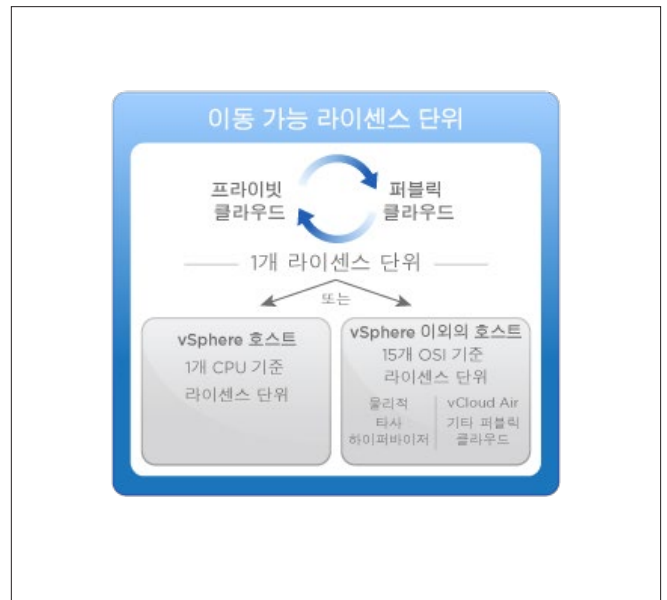
그림 1. 이동 가능 라이선스 단위

vRealize Suite의 PLU 1개를 사용하여 1개의 vSphere CPU에 사내 방식으로 구축된 무제한의 운영 체제 인스턴스(OSI) 또는 퍼블릭 클라우드(VMware vCloud® Air™, vCloud Air Network 파트너, 기타 지원되는 퍼블릭 클라우드 포함) 및 타사 하이퍼바이저와 물리적 서버에 구축된 최대 15개 OSI를 관리할 수 있습니다.