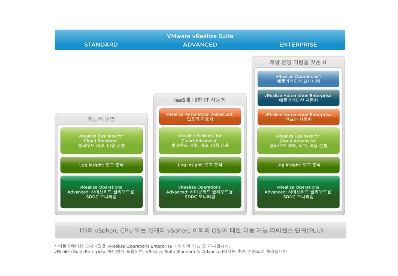
그림 3. vRealize Suite 에디션