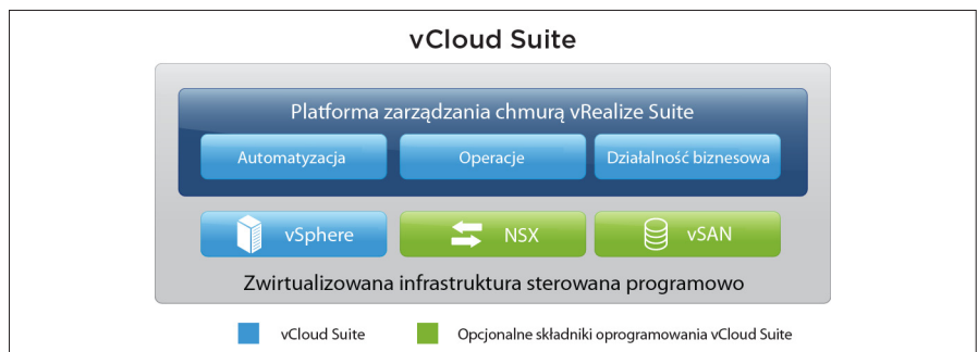
Rysunek 1. Produkty wchodzące w skład pakietu vCloud Suite

Składniki pakietu VMware vRealize są też natywnie zintegrowane z następującymi rozwiązaniami VMware SDDC: VMware vSphere, VMware NSX® i VMware vSAN™. Usługi NSX, np. wirtualne routery, funkcje równoważenia obciążenia i zapory ogniowe, można osadzać w szablonach (wzorcach) usług utworzonych w programie vRealize Automation. Można także tworzyć i zmieniać na żądanie ich instancje w kontekście działającej aplikacji — odpowiednio do potrzeb biznesowych.