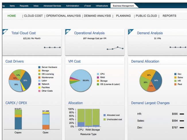
Figura 2. Gerenciamento de negócios para nuvem

O VMware IT Business Management Suite pode ajudar a enfrentar esses desafios. O fornecimento do custo de uma máquina virtual e da utilização de recursos compartilhados auxilia-o a gerenciar melhor a demanda, o orçamento, o CapEx/OpEx, e leva à responsabilidade sobre os recursos em nuvem, reduzindo o custo total de propriedade.