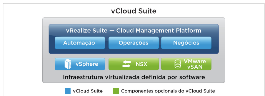
Figura 1: Produtos integrados do vCloud Suite

Os produtos de gerenciamento de nuvem do VMware vRealize também são integrados nativamente com o VMware SDDC: VMware vSphere, VMware NSX® e VMware vSAN™. Estruturas do NSX, como roteadores virtuais, balanceadores de carga e firewalls, podem ser integradas em templates de serviço (Esquemas) criados no vRealize Automation, e instanciadas e alteradas sob demanda no contexto do aplicativo em execução, com base nas necessidades dos negócios.