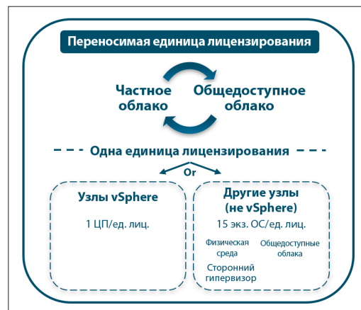
Рис. 1. Переносимая единица лицензирования

Одна переносимая единица лицензирования дает возможность использовать vRealize Suite для управления неограниченным количеством экземпляров ОС, развернутых в локальной среде, на одном процессоре vSphere или 15 экземплярами ОС, развернутыми в общедоступном облаке, в том числе на сторонних гипервизорах и физических серверах.