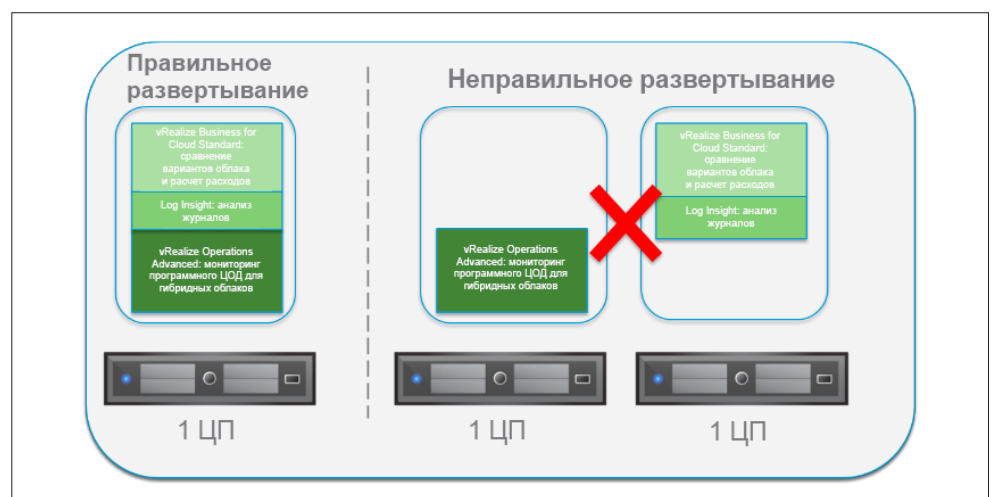
Рис. 2. Правильное и неправильное развертывание

Несмотря на то что в состав пакета vRealize Suite входит несколько компонентов, он представляет собой единое решение с одной лицензией. Все компоненты редакции vRealize Suite лицензируются как одно целое. Одну лицензию vRealize Suite нельзя использовать на нескольких процессорах. Одну и ту же лицензию нельзя использовать для одного компонента (например, vRealize Operations) на одном процессоре и для другого компонента (например, vRealize Log Insight) на другом процессоре (рис. 2).