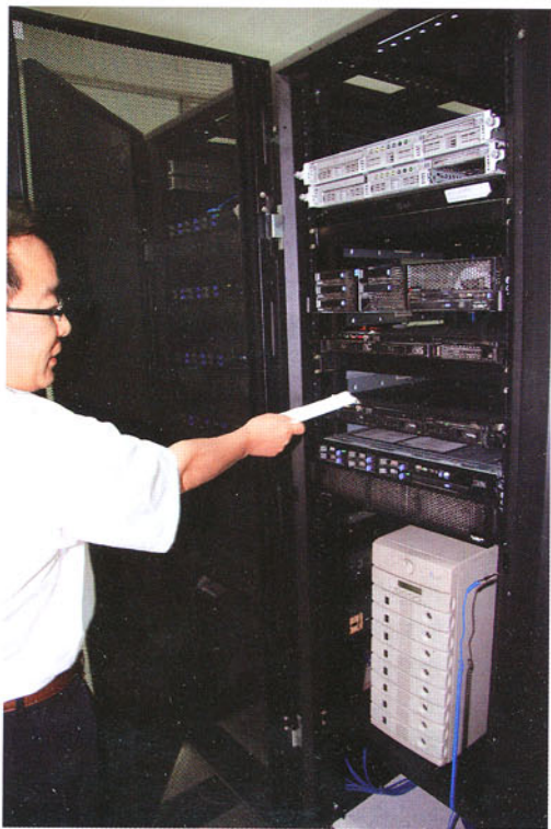
服务器越来越多，许多CIO为此感到头痛

http://www.ccu.com.cn/html/2008/1230/3975.html