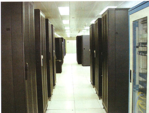
2009年，虚拟化技术会成为焦点中的焦点

显然，在一台服务器上运行多个应用能够提高服务器的效率，并减少需要管理和维护的服务器数量。当工作负载提高时，可以迅速创建更多虚拟机，从而无需增加物理服务器即可灵活地响应不断变化的需求。而且，利用服务器虚拟化，IT管理员