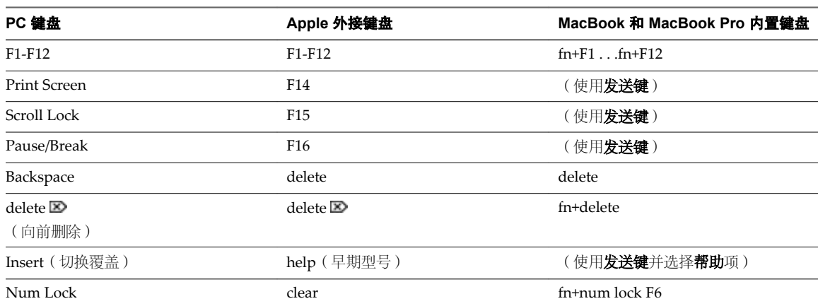
表 3-1 PC 和 Mac 键盘等效按键