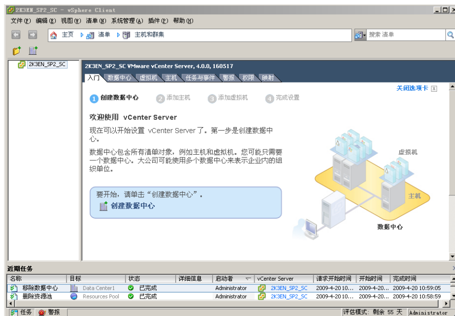
图 4 没有清单对象的 vCenter Server 和入门选项卡向导中的第一步