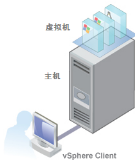
图 1 基本单主机管理系统

完成 ESXi 初始设置之后，可以部署带有 vCenter Server 的 vSphere 以管理多台主机。