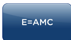
圖 1. 有效的執行 = 協調 + 思維 + 能力 (Figure 1. Effective Execution = Alignment, Mindset and Capabilities)