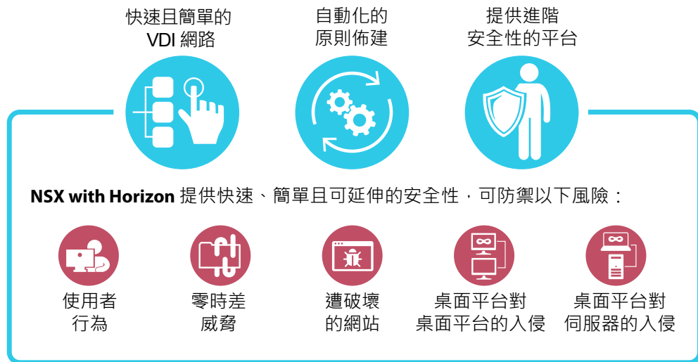
圖 2：NSX for Horizon 提供快速、簡單且可延伸的 VDI 網路和安全性

VMware NSX for Horizon 會有效地確保資料中心內東西向流量的安全，同時確保 IT 能快速且輕鬆地管理網路和安全性原則，這類安全性原則會動態地隨著使用者的虛擬桌面和應用程式移動於基礎架構、裝置和位置間。