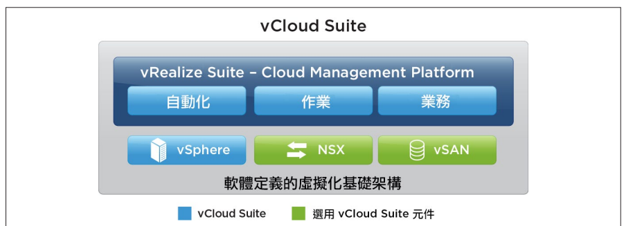
圖 1：vCloud Suite 整合式產品

VMware vRealize 雲端管理產品也能與 VMware 軟體定義的資料中心原生整合：VMware vSphere、VMware NSX® 與 VMware vSAN™。虛擬路由器、負載平衡器和防火牆等 NSX 架構可內嵌到建立於 vRealize Automation 中的服務範本（藍圖），而且可隨選依照執行中應用程式的情境以及業務需求加以具體化和變更。